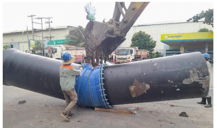
Công ty CP Nước BIWASE Long An tăng tốc phát triển mạng lưới, mở rộng nhà máy đáp ứng nhu cầu sử dụng nước sạch của địa phương.

• Tình hình khô hạn, xâm nhập mặn đang diễn ra gay gắt khiến nhiều địa phương thiếu nước sạch. Sự vươn mình của BIWASE đến các tỉnh đã góp phần giải cơn khát nước ngọt cho người dân, doanh nghiệp và tiếp tục cùng các địa phương bảo đảm cấp nước an toàn, bền vững. Trong năm 2025 BIWASE mở rộng đầu tư, tăng công suất nhà máy nước Nhị Thành (Long An) thêm 60.000 m 3 /ngày đêm, nâng tổng công suất dự kiến 120.000 m 3 /ngày đêm. Đồng thời đặt quyết tâm đưa công trình vào hoạt động trong quý III/2025; mở rộng phạm vi dịch vụ cấp nước đến các huyện Cần Giuộc, Cần Đước tỉnh Long An.