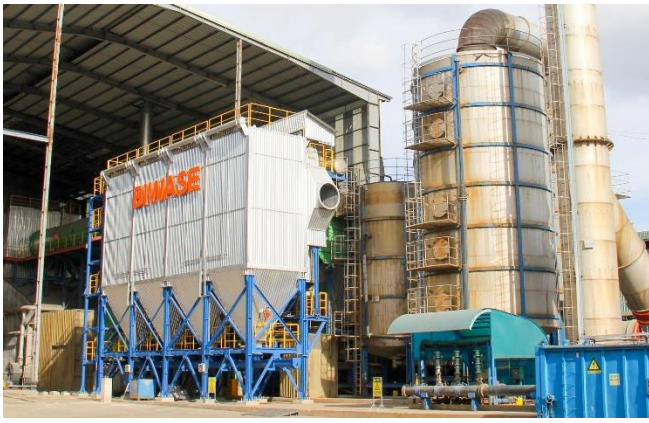
Tổ hợp đốt rác thu hồi nhiệt phát điện 5MW do BIWASE thiết kế và thi công.

bón Con Voi Bình Dương; hoàn thiện và trình duyệt phương án giá rác thải mới.