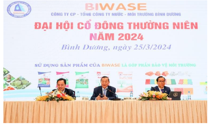
Đại hội cổ đông BIWASE năm 2024 (ảnh tư liệu).

• Hội đồng quản trị Công ty CP – Tổng công ty Nước - Môi trường Bình Dương (BIWASE) quyết định ngày 26/3/2025 là ngày Đại hội cổ đông thường niên năm 2025. Đại hội sẽ công bố kết quả sản xuất kinh doanh năm 2024 với tổng doanh thu 4.387 tỷ đồng, lợi nhuận sau thuế 568 tỷ đồng, tỷ lệ thất thoát nước chỉ ở mức 4,8%. Chia cổ tức tối thiểu 13% bằng tiền mặt, tương đương số tiền 285,9 tỷ đồng. Đồng thời đại hội sẽ thông qua các mục tiêu chiến lược, nghị quyết về đầu tư, sản xuất kinh doanh, tăng trưởng năm 2025 cùng những năm tiếp theo. Sắp đến ngày đại hội, cổ phiếu BIWASE (BWE) đang có xu hướng tăng.