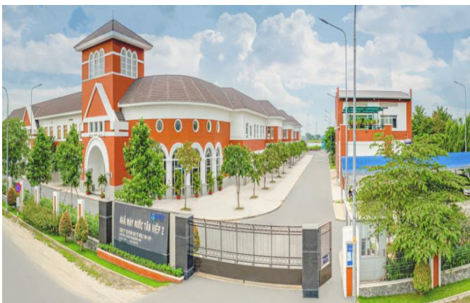
Nhà máy nước Tân Hiệp công suất 300.000m 3 /ngày đêm.

• Đầu tư tái chế sâu rác thải. Khối lượng rác tiếp nhận trong năm 2024 là 970.656 tấn, trung bình tiếp nhận và xử lý khoảng 2.659 tấn/ngày, tăng 4% so với cùng kỳ năm 2023 (2.554 tấn/ngày). BIWASE đang nghiên cứu đầu tư mở rộng thị trường ở những nơi có tính chiến lược, kết hợp nghiên cứu các giải pháp xử lý rác ngày càng sâu hơn, hiện đại hơn như: Xây dựng lò đốt rác mới công suất 500 tấn/ngày, kết hợp phát điện với công suất 12MW. Nâng tổng công suất của nhà máy xử lý chất thải thành năng lượng lên 17MW. Trong đó bán khoảng 7 MW và sử dụng 10 MW cho mục đích nội bộ. Tiếp tục nghiên cứu tìm giải pháp đầu ra cho sản phẩm tái chế, nhất là phân